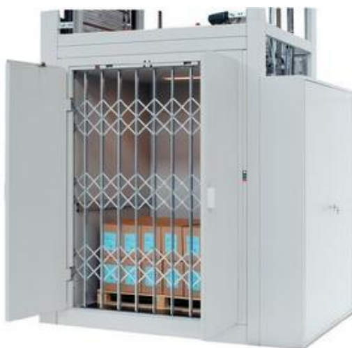
Nákladný výťah Microfreight so zaťahovacími dverami kabíny

Nákladný výťah Microfreight je navrhnutý tak, aby bol jednoduchý, rýchly, hospodárny a spoľahlivý pri dvíhaní ťažkých nákladov v obchodoch, priemysle, supermarketoch, skladoch a v mnohých iných zariadeniach, kde je potrebný pohyb paliet, nákladov, vozíkov, kontajnerov, ťažkých nákladov a pod. Skúsenosti a know-how sa rozvíjajú viac ako 50 rokov na veľmi náročných trhoch vo svete. Majú vedúce postavenie vo vývoji vysokomoderných výťahov, ktoré šetria priestor a majú príjemný a estetický dizajn.